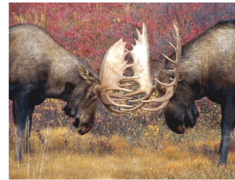
Ilustración: National Geographic en un artículo sobre el alce de Alaska (los alces de mayor tamaño) decía que los machos de la especie luchan por el dominio durante la temporada de celo otoñal. Los alces literalmente, golpean cabeza con cabeza por los cuernos chocando estrepitosamente. A menudo, las astas, su única arma con que cuentan se rompen. Cuando esto pasa, tienen la derrota asegurada. El alce más grande y saludable, con los cuernos más grandes y fuertes, triunfará. Por tanto, la batalla que tiene lugar en el otoño realmente se gana durante el verano, cuando el alce

La lucha entre el Espíritu y la carne es tan radical que se debe crucificar a la carne (Gá 5:24, 2:20). El día de nuestra salvación el viejo hombre quedó muerto. El hombre nuevo tiene el privilegio de que Cristo more en él para capacitarlo a vivir en el Espíritu.