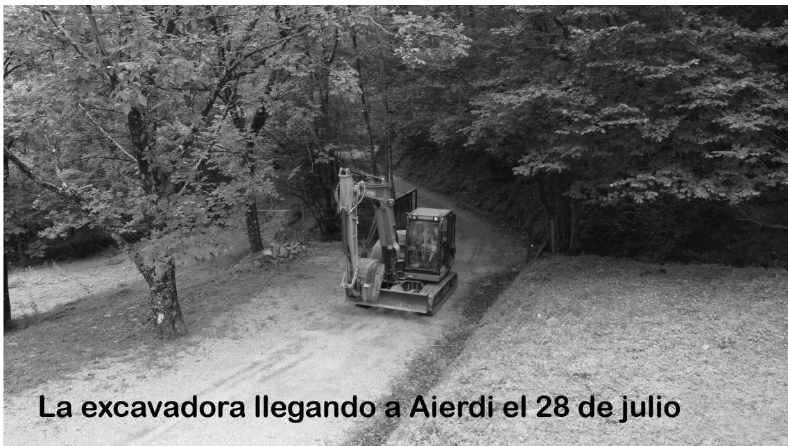
La excavadora llegando a Aierdi el 28 de julio